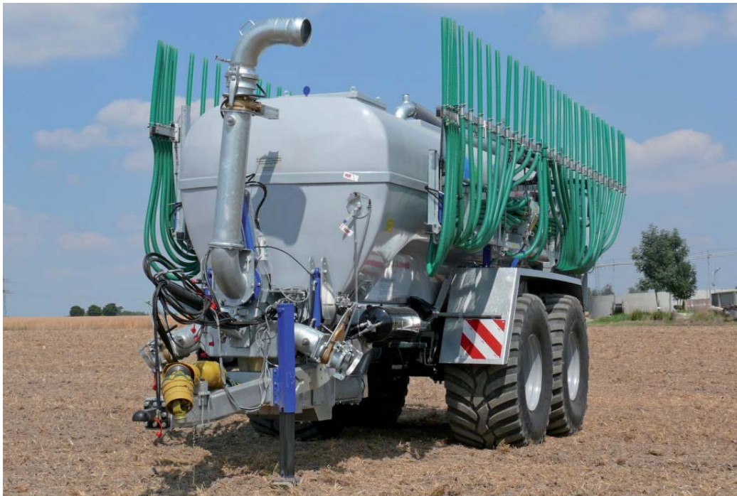
BPK 190 mit Schleppschauchverteiler und hydraulisch schwenkbarem Saugarm.

Durch die Herstellung der Tanks im Hand-Laminier-Verfahren können – je nach Notwendigkeit – unterschiedliche Wandstärken gefertigt werden. An tragenden Stellen können so Verstärkungen realisiert werden, ohne den Tank insgesamt stärker und somit auch schwerer machen zu müssen.