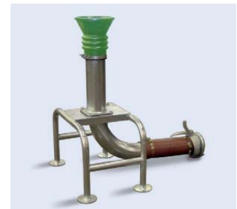
Serienmäßiger BSA Andockbock bei Saugarm.